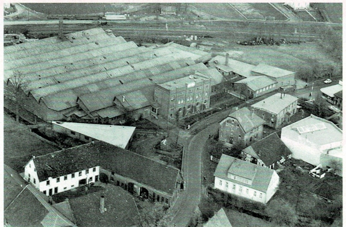
Die alte Seilerei ist heute aus dem Stadtbild verschwunden.